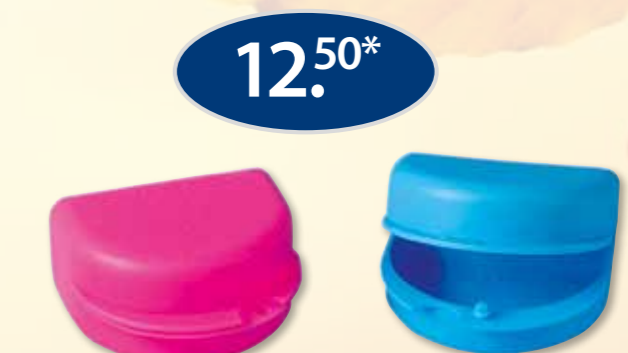
Dento Box II: hoogte 4 cm