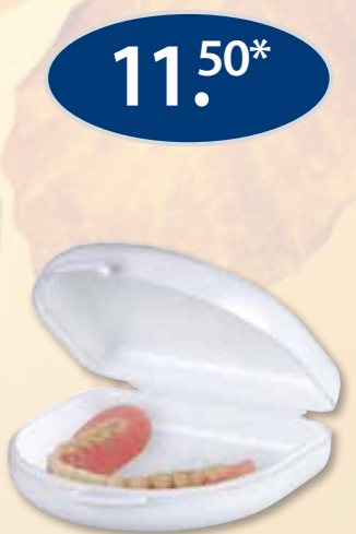
Dento Box I: hoogte 2,5 cm